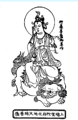
永地文殊堂水郡陀堂上